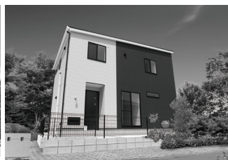
苅田町 N 様邸