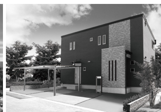
小倉南区 S 様邸