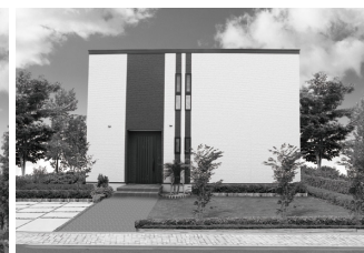
北泉モデルハウス