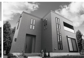
富久モデルハウス