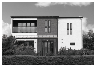
北泉モデルハウス