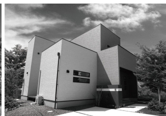
苅田町 T 様邸