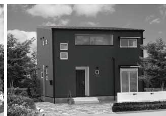
鞍手郡 H 様邸