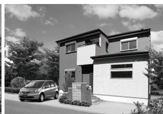
中間市 Y 様邸