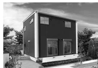
遠賀市 Y 様邸